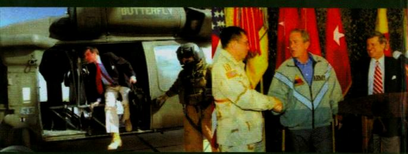
زيارة الرئيس المشاجنة في عيد الشكر